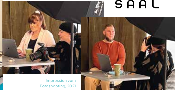
Impression vom Fotoshooting, 2021